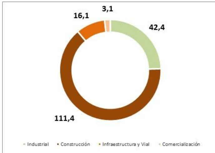
AÑO 2016 (MMUSD)